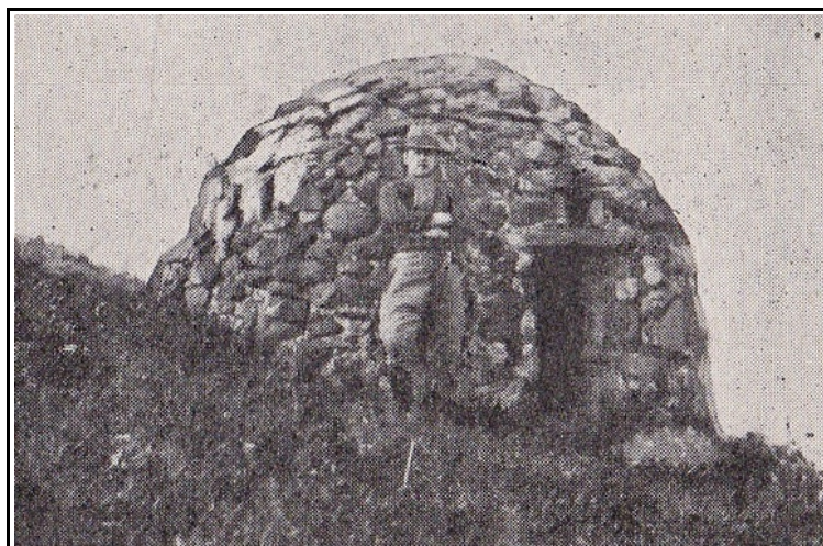
Cabane du plateau des Côtes de Clermont au début des années 30 (M. Busset, 1933)

Si vous souhaitez donc soutenir financièrement le dernier projet de l'ASCOT, vous trouverez les modalités en dernière page. Et nous en profitons pour remercier nos adhérents qui, par leur cotisation régulière, nous ont permis de mener à bien nos différents et importants projets de valorisation sur « notre » site.