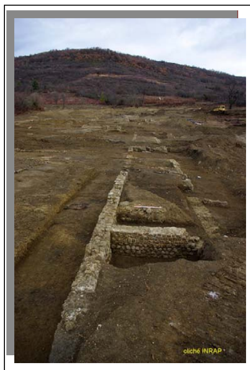
Photo 1 : vue en perspective des constructions formant galerie d'accès aux bâtiments résidentiels de la villa. (fouille de Trémonteix)

Ainsi, nous sommes à Trémonteix en présence d'un domaine d'exploitation gallo-romain de grande taille, associant une cour d'accès imposante, bordée de bâtiments ou pavillons, et une partie réservée à l'habitat et la villégiature. Construits au bas de la pente, les bâtiments appartenant à cette pars urbana étaient ceinturés en amont par des murs de terrasse. Outre la protection contre l'érosion et le ruissellement, cet aménagement de la pente en amont des bâtiments pourrait avoir joué un rôle paysager.