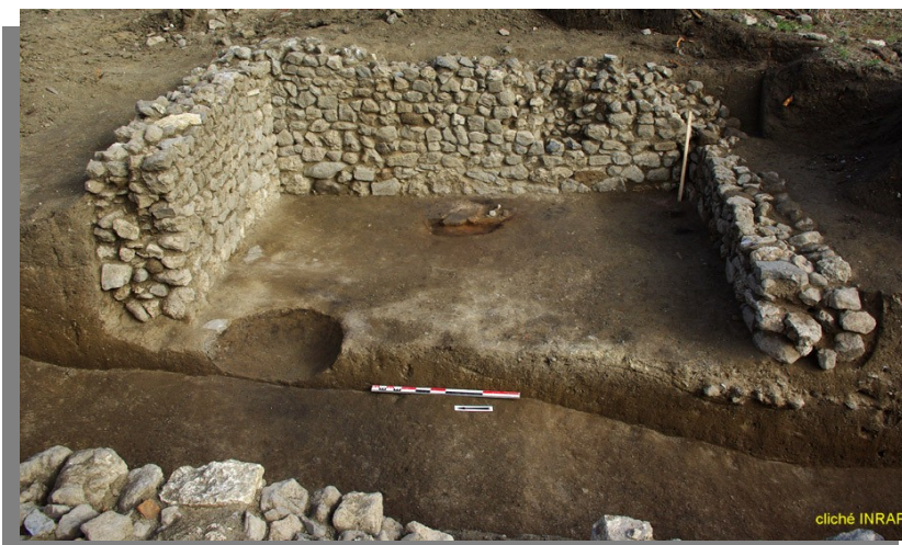
Photo 4 : coupe transversale dans un bâtiment médiéval construit en pierres sèches et conservé sur 1,50 m de hauteur au maximum. Il s'agit d'une construction semi-enterrée avec pour aménagement intérieur un foyer sommaire (au fond au centre) et une fosse (dans la coupe à gauche).

Les bâtiments sont tous construits en pierres sèches et au moins partiellement enterrés. Deux d'entre eux doivent à la forte pente du vallon une conservation exceptionnelle [PHOTO 4].