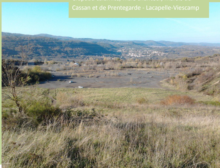
Crapaud calamite, mâle chanteur, Marais du Cassan et de Prentegarde - Lacapelle-Viescamp

Toutes les espèces connues du secteur ont été inventoriées. L'Albâtre et surtout le Crapaud calamite semblent bien implantés avec de gros effectifs présents sur la zone centrale de la carrière. Cependant, les usages du site (quad, moto...) et l'assèchement très précoce selon années de certaines lames d'eau superficielles, nuisent au déroulement complet du cycle de reproduction du Crapaud calamite. Une vraie réflexion d'aménagement de gestion devrait être menée afin de concilier les nombreux usages du site et la biodiversité (et notamment les enjeux batrachologiques).